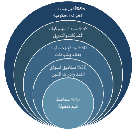
الحدود الاستثمارية للصندوق

- في حالة تقديم طلب الشراء قبل الساعة الثانية عشر ظهراً: يتم تنفيذ الطلب على اساس السعر المعلن في نفس يوم تقديم الطلب وعلى أساس نصيب الوثيقة في صافي القيمة السوقية لأصول الصندوق في نهاية يوم العمل السابق لتقديم طلب الشراء - في حالة تقديم طلب الشراء بعد الساعة الثانية عشر ظهراً: يتم تحجيل تنفيذ الطلب ليوم العمل التالي على أساس نصيب الوثيقة في صافي القيمة السوقية لأصول الصندوق في نهاية يوم تقديم طلب الشراء والمعلن في صباح اليوم التالي. ويتم تلقي طلبات الاسترداد طوال أيام الأسبوع ويتم تنفيذها يومي 15 و30 من كل شهر.